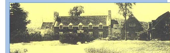
« Un domaine au style écossais... des murs de bardeaux fendus à la hache... toitures recouvertes de bardeaux vert bouteille... superbe épinette... 2 cheminées fumant l'hiver. Un monument à la fortune des Price'Brothers. »

« Quelques jours après ma consécration du 15 août '57, je quitterai le cloître de Château-Richer, sûr d'être renforcé contre tout. De nouvelles portes s'ouvrent devant moi, celles de l'Hermitage St-Joseph. L'ancien domaine de la famille Price'Brothers avait été ainsi rebaptisé.